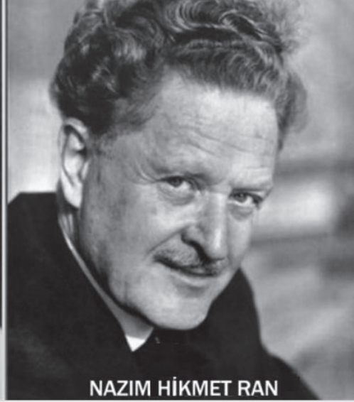
NAZIM HİKMET RAN